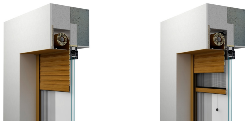
Widok od zewnątrz